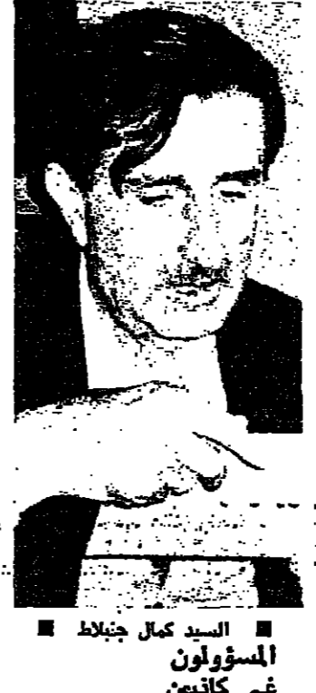
السيد كمال جنبراط

رد السيد كمال جنبراط على خطاب الرئيس صلف سلام الذي اتهم المسؤولين بظلم وعدم الدفاع عن البلاد . وقال جنبراط ان المسؤولون هم الذين ليسوا المسؤولون ولكن رؤساء الحكومات المسؤولة تقع على رؤساء الحكومات وقال : «انا بدي اوضح على كل حال السواقين زادا اسماهم .. عمتقوا الزيادة ؟ عال ؟ انا بدي اسلمهم من وين بنا نجيب الاموال لتغطية نفقات الخبز» ثم قال الرئيس الصلح للصحفيين انه يريد الذهاب الى البيت (الساعة) كاتت نشر الى الثانية عشرة ظهرا (لا تخطب : حاسني اني بدي (كرب) يمكن يصير معسي كريب . وسال الصحفيين اذا كانوا يشعرون بالبرد ، وقال : اليوم حاسني بارد .. ثم نقل لاج .. لرئيس الصلح : ان شاء الله تشي لاج وتشني كت .. حتى يوبل اللج ويصير في كي كي .. ومشر بلشج والصفيفي . وسال : وما هما اذا كان مستقيل احدا بعد الظهر غلبي : مستقيل اميل بطير وزير الصحة السابق .. وما عندي شي بدي ارتاح .